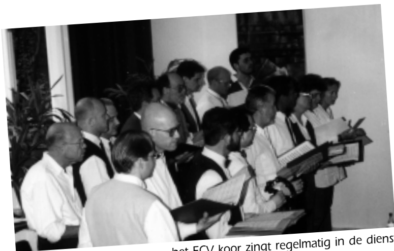
het ECV koor zingt regelmatig in de dienst